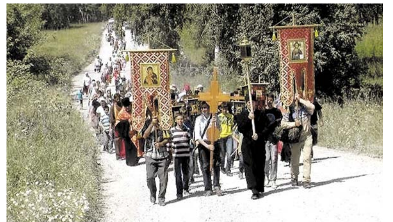
Крестный ход в память святых Царственных страсотерпцев