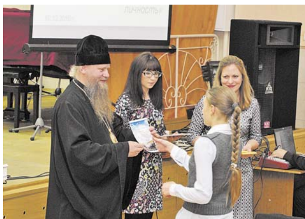
V Искитимские Рождественские образовательные чтения