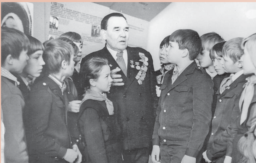
Встреча со школьниками. 21 января 1980 год.