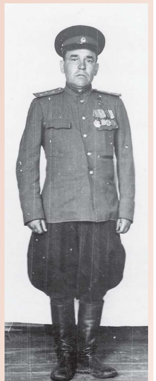
Командир стрелковой роты 39 стрелковой дивизии. 1946 год, г. Хабаровск.

Бюст Героя установлен на Аллее Славы в городе Искитим Новосибирской области.