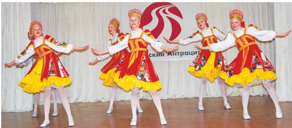
В праздничной программе принял участие танцевальный коллектив «Радость» – гордость Искитимского района.

А «Сибирскому Антрациту» я желаю дальнейшего развития и процветания, и, конечно, увеличения объемов производства!»