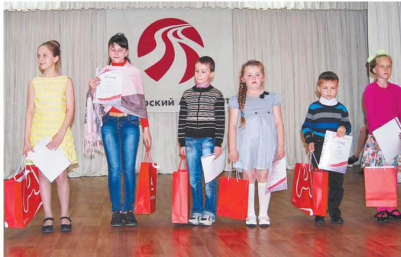
Победители конкурса были награждены призами и дипломами.