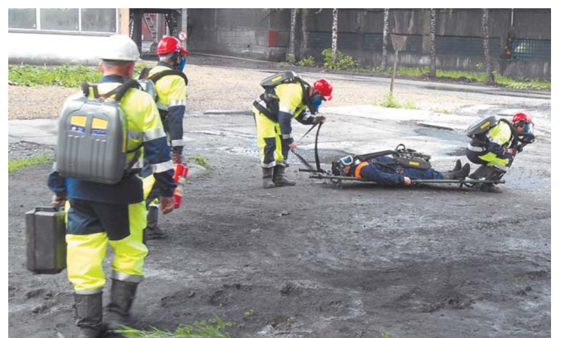
Оказание первой помощи пострадавшему во время пожара.