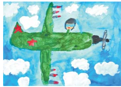
Рисунки Вадима Яруша (1 место в младшей группе) оптимистичны и праздничны: «Мирное небо» и «Парад Победы».