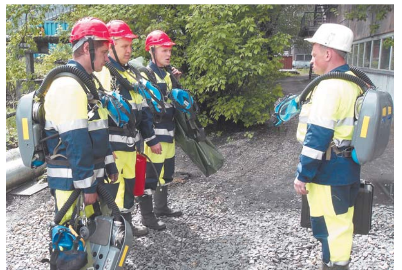
Отделение ВГК к ликвидации аварии готово. Командир отделения доводит поставленную задачу своему отделению.