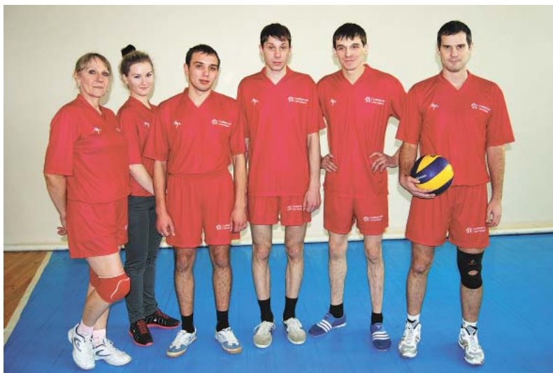
В этом году стать первыми в волейболе не удалось. Но участники команды этот проигрыш восприняли как стимул к победе летом. Теперь дело за тренировками.