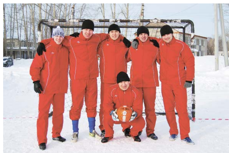
Команда футболистов заняла второе место на пьедестале Почета. Поздравляем ребят с победой!