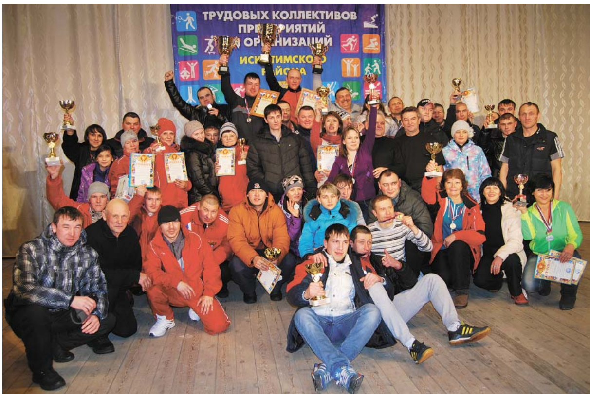
Фотография на память: команды-победители! Первое место – ЗАО «ЭПМ – НовЭЗ», второе – ЗАО «Сибирский Антрацит», третье – ОАО «Новосибирская птицефабрика».

Нина Gladkova, специалист отдела по связям с общественностью, фото автора.